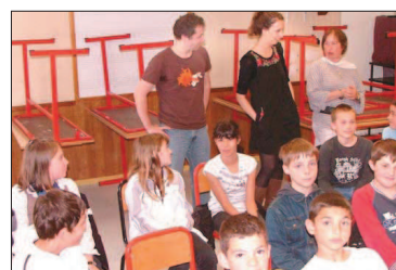
Les collégiens ont essayé de réciter des tirades.

Les élèves ont enfin pris la place des acteurs pour s'es-sayer à dire quelques tirades dans un style déclamatoire et