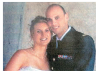
Ils résident à Saverne.