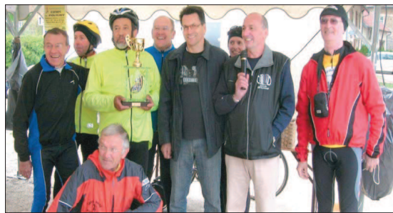
La Quingéoise attire les participants de toute la France.

Le club cyclo de Pontarlier qui avait le plus de coureurs engagés a reçu le trophée qui sera remis en jeu en 2011.