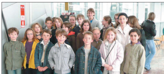
Ils ont assisté à un opéra de Prokofiev à l'Auditorium.

La section théâtrale de l'Association d'éducation populaire (AEP) se déplaçait à Dijon dimanche dernier pour assister à un opéra, « L'amour des trois oranges » de Prokofiev, une farce burlesque inspirée d'un conte pour enfants.