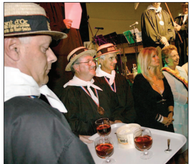
Moment sacré de l'intronisation du mont d'or.

Mails : lerredapcn@estrepublikain.fr Publicité : Adeline Billod, tél. 03.81.46.95.15. Estelle Taillard, tél. 03.81.46.95.16.