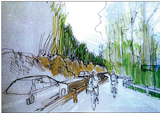
La voie verte partagera la route et les voitures seront en circulation alternée sur certaines portions.

Le public qui s'intéressera au dossier de l'enquête n'y trouvera toutefois aucun scoop. Le projet a tellement fait couler d'encre, provoqué tant de réunions de concertation et de comité de pilotage que les parties concernées savent ce qu'il en est.