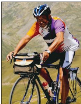
■ Le président du club de cyclotourisme de Pontarlier.