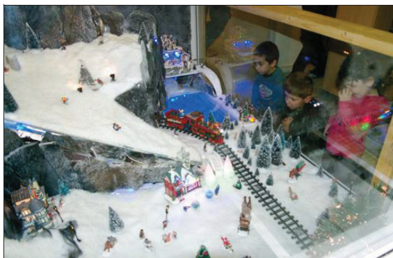
■ Les enfants toujours ébahis par les prouesses que réalise leur papa à chaque Noël.

A tout cela est venue s'ajouter de nouvelle petite maison avec, entre autres, la brasserie, l'usine à chocolat, l'église venue compléter une cinquantaine de personnages, et bien sûr un grand panel d'animaux comme des loups, biches, ours, une vraie ménagerie dans quelques m 2 et tout cela